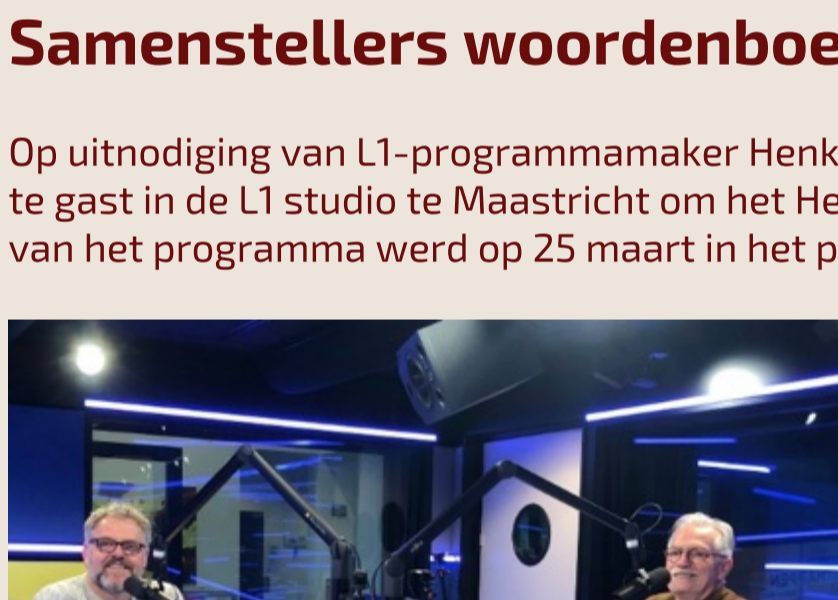
Henk Hover en Maarten Peskens

Op uitnodiging van L1-programmamaker Henk Hover waren Maarten Peskens en Sef Deckers te gast in de L1 studio te Maastricht om het Heitser woordenboek te promoten. De opname van het programma werd op 25 maart in het programma Plat-eweg uitgezonden.